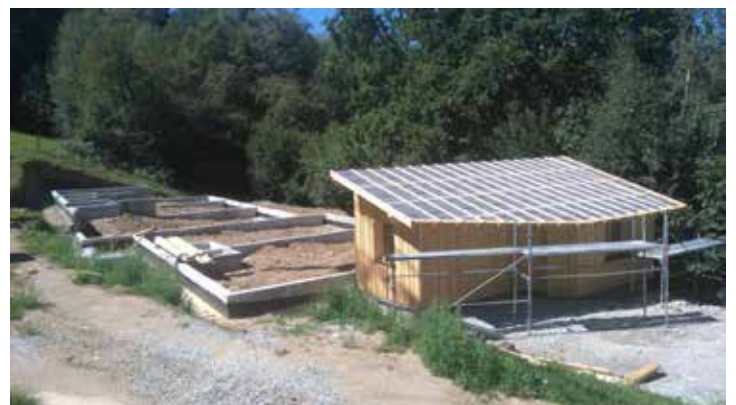
Chantier de reconstruction du Centre d'élevage du Gypaète Barbu